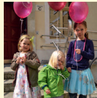
HSKD, Glacisstr. 30/32, 01099 Dresden Informationen unter: www.hskd.de

Am 30. Mai 2015 öffnet das HSKD von 10 bis 13 Uhr wieder seine Pforten und lädt alle musik- und tanzinteressierten Kinder und Erwachsenen ein. Doch bei uns darf nicht nur geschaut werden! Wer möchte, kann in die Tasten hauen, die Saiten schwingen oder trommeln, was das Zeug hält. Für Verpflegung ist natürlich gesorgt und gutes Wetter bei Petrus beantragt. Wir freuen uns auf euer und Ihr Kommen!